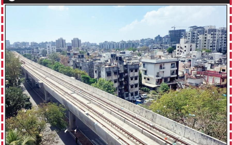
સુરત શહેરમાં મેટ્રો રેલ પ્રોજેક્ટનું કામ પુરુજોશમાં ચાલી રહ્યું છે. સુરતના અત્યંત મહત્વપૂર્ણ મેટ્રો રેલ પ્રોજેક્ટ જુદા જુદા વિસ્તારોમાં અલગ અલગ તબક્કામાં છે. અડાજણ સ્ટાર બજારથી પાલ એલપી સવાણી રોડ પરના મેટ્રો રેલના રૂટ પર ટ્રેક બીછાવી દેવામાં આવ્યા છે. જ્યારે સ્ટાર બજાર મેટ્રો સ્ટેશનનું કામ પણ મોટા ભાગે પૂર્ણ થઈ ગયું છે. સુરતના મહત્વપૂર્ણ મેટ્રો ટ્રેન રેલ પ્રોજેક્ટની આ તસ્વીરો 'પ્રતાપ દર્પણ' ના વાચક ફેનિલ ૬૬૬૨ દ્વારા મોકલવામાં આવી છે.