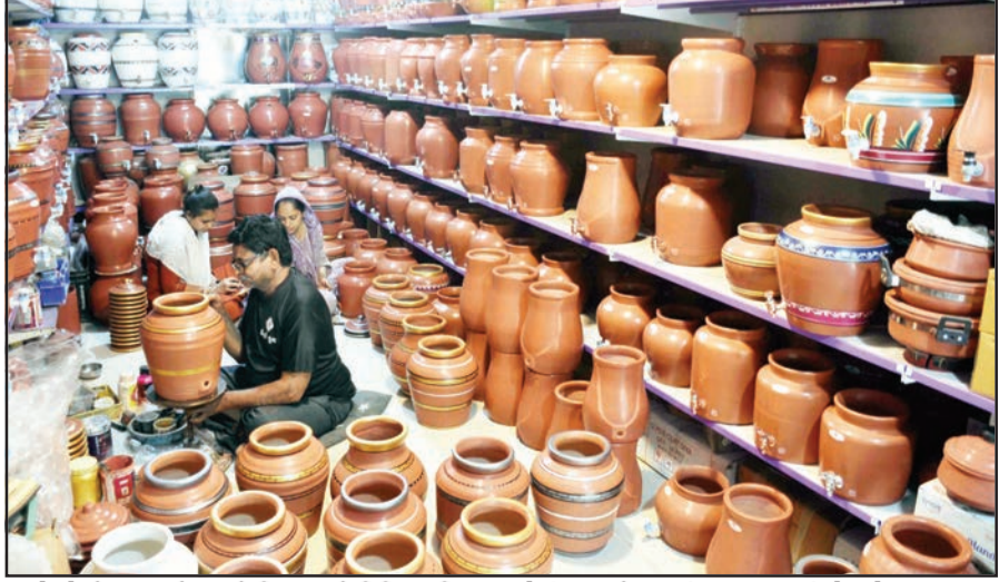
આજે હોળી મહા પર્વ બાદથી શિયાળાની વિધિવત વેચાણ સાથે ઉનાળાની ઝટતુનું આગમન થતું હોય છે. બજાબજા ઉનાળામાં પરંપરાગત માટીના માટલાનું શિતળ પાણી રાહતદાયક હોય છે. બજાબજા ઉનાળો શરૂ થાય તે પૂર્વે જ સુરતની બજારોમાં માટીના નવા નક્કર માટલા વેચાણ અર્થે મોટી માત્રામાં આવી ગયા છે.