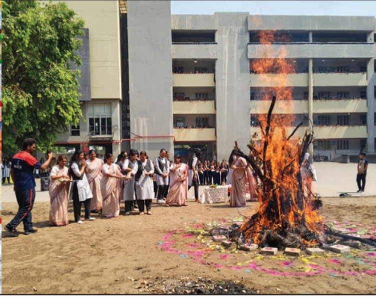
હોળી-ધૂળેટી તહેવારોમાં ખજુર, સાકર, હારડા વગેરેનું પરંપરાગત ખૂબ મહત્વ છે. અને રંગ પર્વ માટે રંગોનું ઘૂમ વેચાણ થાય છે. સુરતના બજારોમાં રંગબેરંગી સાકર હારડા તથા વિવિધ પ્રકારના રંગોનું વેચાણ થતું હોવાનું તથા શાળામાં આજે સવારે હોળીકાદહન કાર્યક્રમ યોજાયો હોવાનું તસ્વીરોમાં જણાય છે.