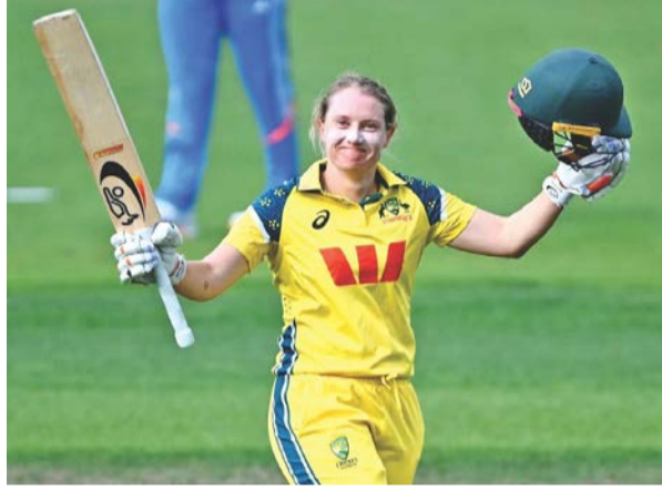
તબક્કે ઓસ્ટ્રેલિયાએ ૩૬ ઓવર સુધીમાં જ ૨૮૧ રન કરી નાખ્યા હતા. ત્યાર બાદ એનાબેલ સધરલેન્ડે ૨૩ અને નિકોલા કેરીએ માત્ર ૧૫ બોલમાં અણનમ ૩૪ રન ફટકારી દીધા હતા. ૪૧૦ રનના

ઓસ્ટ્રેલિયાની મહાન વિમેન્સ ક્રિકેટર એલિસા હિલીએ રવિવારે ભારત સામેની ત્રીજી અને અંતિમ વન-ડે ક્રિકેટ મેચમાં ૧૫૮ રનની જંગી ઈન્વિન્સ રમીને વિમેન્સ વન-ડે ક્રિકેટમાંથી નિવૃત્તિ લઈ લીધી હતી. આ સાથે એક સફળ કારકિર્દીની પૂર્ણાહુતિ થઈ હતી. જોકે ભારતીય વિમેન્સ ટીમ માટે આ મેચ ખાસ યાદગાર રહી ન હતી કેમ કે આ મેચમાં તેનો ૧૮૫ રનના કપરો માર્જીનથી પરાજય થયો હતો અને સાથે સાથે તેનો ત્રણ મેચની આ સિરીઝમાં વ્હાઈટવોશ થયો હતો. રવિવારે અહીં રમાયેલી ત્રીજી વન-ડે ક્રિકેટ મેચમાં પ્રથમ બેટિંગ કરતાં ઓસ્ટ્રેલિયા વિમેન્સે ૫૦ ઓવરમાં સાત વિકેટે ૪૦૯ રનનો વિશાળ સ્કોર રજૂ કર્યો હતો જેના જવાબમાં ભારતીય વિમેન્સ ટીમ ૪૫.૧